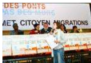
Sommet citoyen Des Ponts Pas de Murs.

En France, nombreuses sont les associations qui œuvrent pour renforcer la solidarité entre les peuples . Elles agissent pour faciliter les échanges culturels, pour faire évoluer les mentalités, pour améliorer la compréhension des phénomènes migratoires, pour faire respecter les droits des étrangers ou pour promouvoir la paix . Elles permettent ainsi à chaque citoyen de s'investir collectivement pour défendre l'égalité et la justice dans le monde.