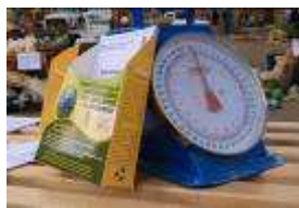
Sedal et Bionida