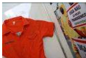
Campagne de Greenpeace contre la culture du maïs transgénique.

Le développement durable tient compte des interactions entre les dimensions économique, écologique, sociale, culturelle et politique du développement. Locales et mondiales, il convient de les transformer en solidarités dans les comportements et dans les actes. Le concept de développement durable est né de deux constats : la fracture Nord/Sud et la recherche d'un développement humain ; la crise écologique et l'urgence de sauvegarder la planète.