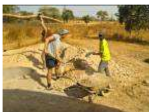
Voyage solidaire au Sénégal. www.icd-afrique.org

L'impact du tourisme de masse sur les sociétés et l'environnement est bien souvent très négatif. Aujourd'hui, il existe des moyens de voyager autrement : tourisme solidaire, équitable, responsable, éthique, ou écotourisme... Diverses solutions existent pour les voyageurs qui souhaitent respecter l'environnement et la culture des pays qu'ils visitent, en partageant des moments de vie avec leurs habitants et en favorisant un développement à long terme.