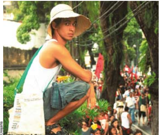
Forum social mondial à Belém (Brésil). Réfléchir à un intérêt général mondial est plus que jamais nécessaire.

En attendant, il faudrait aussi réformer les institutions financières internationales. Là encore, les nouveaux rapports de force devraient finir par modifier le tour de table du Fonds monétaire international (FMI) et de la Banque mondiale. Pour autant, le pouvoir devrait y demeurer dans les mains des plus gros