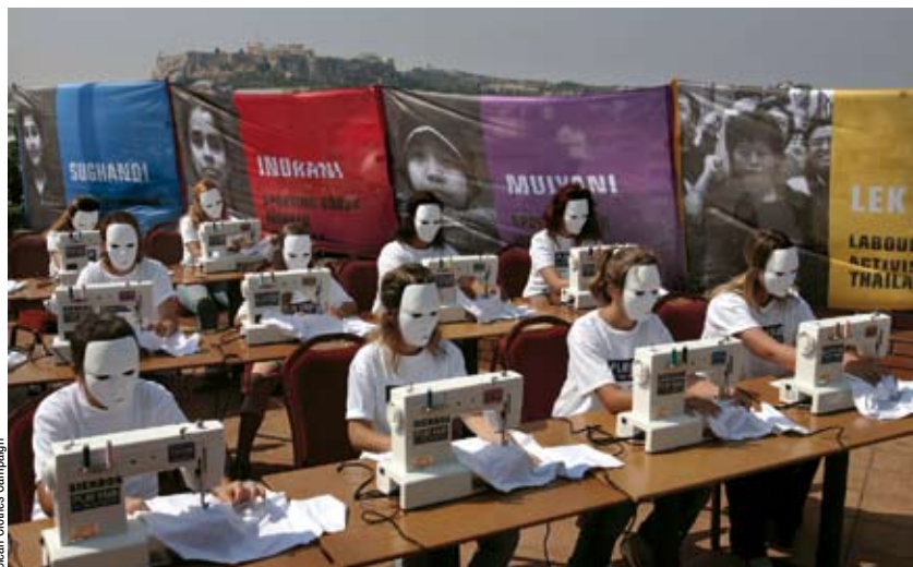
Clean Clothes Campaign

Artisans du monde, des syndicats, comme la CFDT et la FSU, et des associations comme Léo Lagrange.